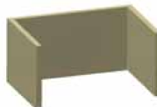
INTERIOR VERMICULITA 750 kg/m 3 . Gran poder de refracción.