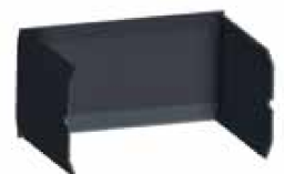
INTERIOR ACERO REFORZADO. Gran poder de transmisión que se mantiene por más tiempo.