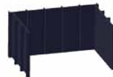
INTERIOR ACERO. Gran poder de transmisión de calor.